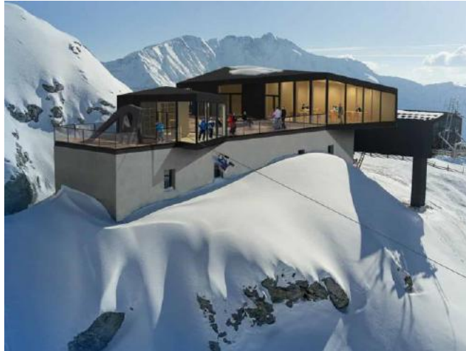
Le départ de la tyrolienne