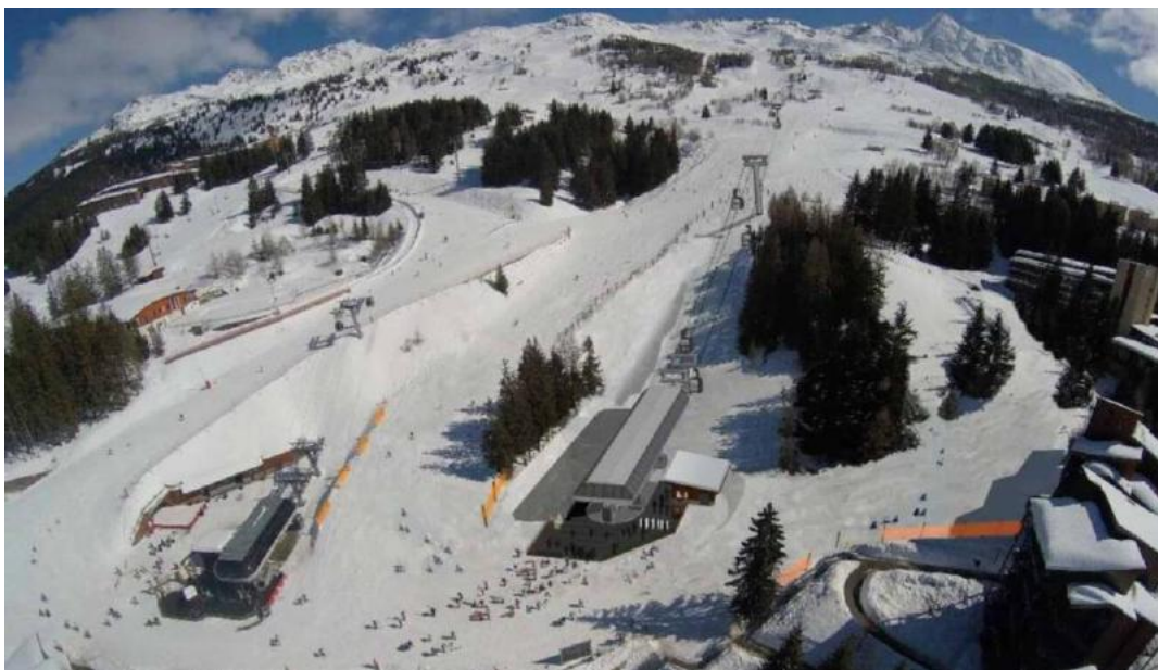
Vue d'artiste du futur nouveau départ du Transarc et la nouvelle piste d'arrivée sur la droite, qui diminuerait sensiblement le rideau existant entre les résidences Mirantin 1, 2 et 3 et le Transarc. 3A se rapprochera des copropriétés concernées pour formuler des observations concertées.

La rénovation du Transarc, retardée pour cause de crise sanitaire et désormais prévue pour 2023, s'accompagnera d'un remodelage de l'arrivée des pistes vers la station de départ. Ce remodelage suppose un déboisement qui fait actuellement (du 5 juillet au 5 août 21) l'objet d' une enquête publique . On pourra consulter l'avis de la Mission Régionale d'Autorité Environnementale sur le l'ensemble du projet de rénovation du Transarc ici , ou tout le dossier du défrichement ici .