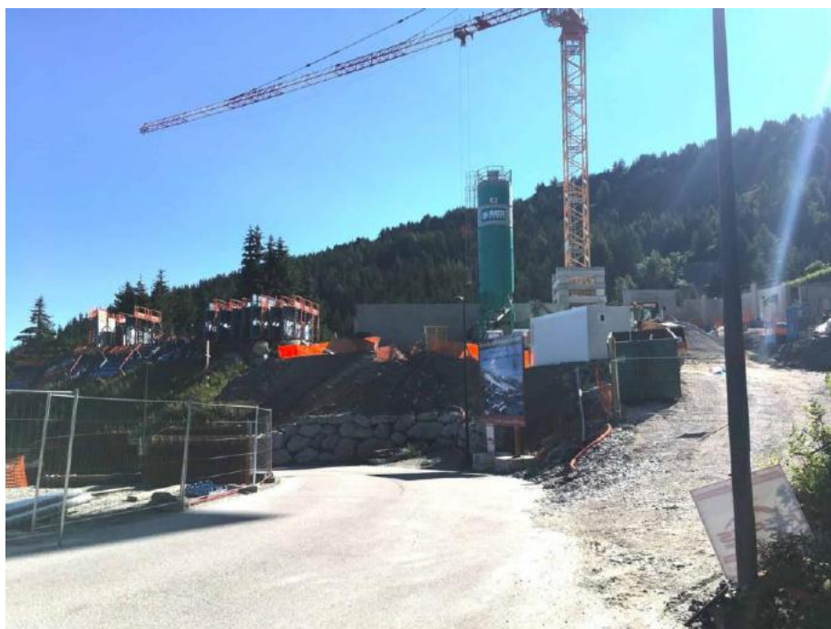
Le chantier des Cristaux vu de la route des Espagnols sous Edenarc