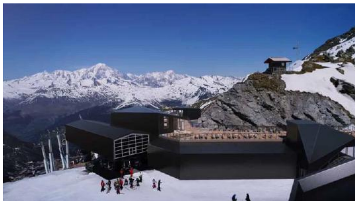
À l'arrivée du Varet, un solarium.