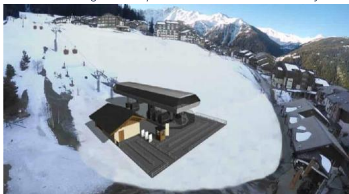
La future gare d'arrivée, qui devrait abriter un musée de la flore et de la faune en Vanoise