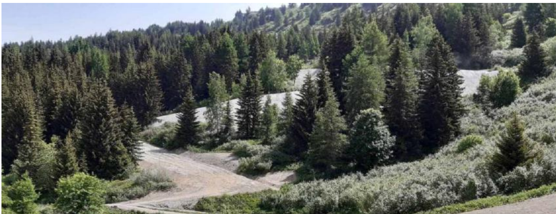
La route reliant le carrefour des 4 chemins au restaurant de l'Arpette a été considérablement élargie, permettant ainsi un retour à ski direct sur les Cristaux.