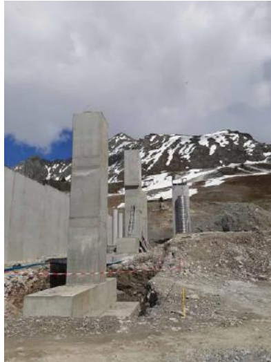
Le chantier de la gare d'arrivée début juillet

La grande nouveauté de cet hiver sera le remplacement du télésiège de Vallandry par une télécabine 10 personnes dernier cri. Le débit du télésiège était de 2400 personnes/heure, celle de la télécabine sera initialement de 2700 p/h pour atteindre 3000 p/h en phase définitive.